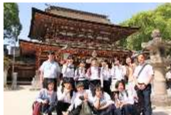
▲ 太宰府天満宮にて

昨今の物価上昇やバス借上代高騰などにより旅行代金も上がっています。今回の旅行には町からもたくさんの補助をいただいています。この場をお借りして感謝申し上げます。