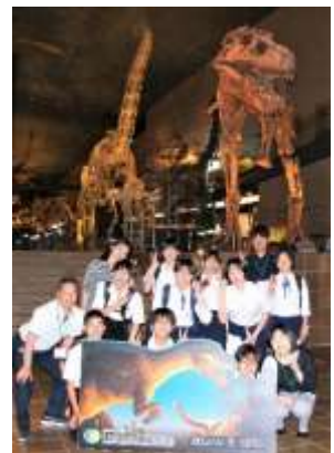
▲ ティラノサウルスと