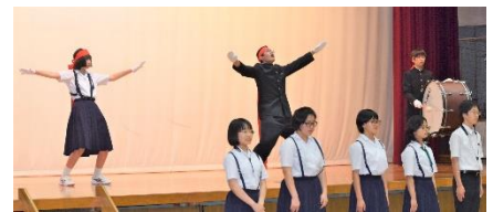
伝統の応援団によるエール