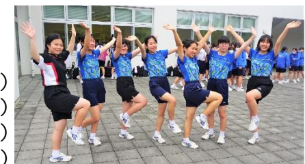
女子バドミントン部3年生