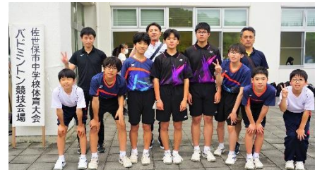
男子バドミントン部