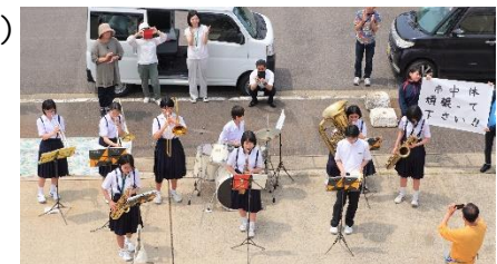
吹奏楽部による応援演奏