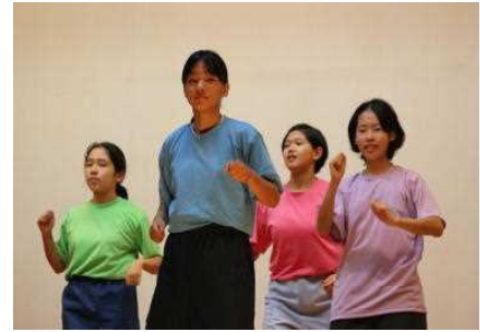
【2年生ファッションショー】