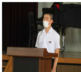
生徒会長あいさつ