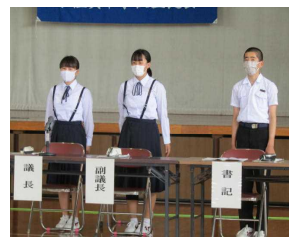
議長・副議長・書記の選出、あいさつ