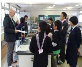
11月19日(火) イングリッシュデー

アメリカ・オーストラリア・スコットランド・カナダなど11名のゲストに協力で国際色豊かな一日でした。そして、オープニングの活動を考えた高校生のアイデアもよかったです。