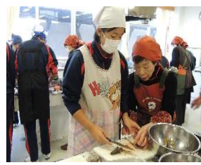
11月20日(水) 郷土料理教室

アメリカ・オーストラリア・スコットランド・カナダなど11名のゲストに協力で国際色豊かな一日でした。そして、オープニングの活動を考えた高校生のアイデアもよかったです。